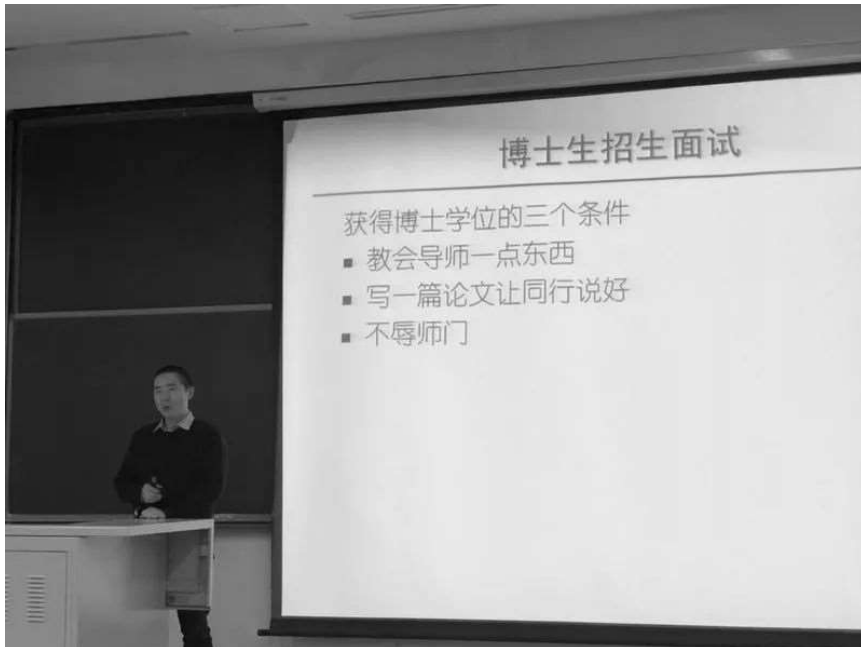
获得博士学位的条件

你现在可能了解，也可能不了解，获得博士学位需要一些必需条件。有同学说我要发表足够的文章，我要有足够多的成果，我要写一篇好的学位论文，要评审获得好的意见，同时还要找到好的工作，最后才开始申请毕业答辩。对，都对。都不太对。这些是自然而然的过过程，这些不是最主要的。我觉得你应该问自己， 第一，你是不是能够教会老师一点东西？